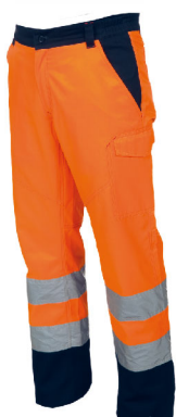
Arancione Fluo Blu Navy