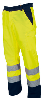
Giallo Fluo Blu Navy