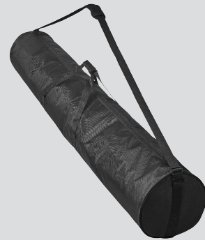
Borsa di trasporto e stoccaggio

*Da impiegare se l'accesso allo spazio confinato lo richiede ad esempio se non c'è una scala di accesso, o se si necessita di movimentare carichi. Se avete bisogno di aggiungere il winch al Vostro kit aggiungete i seguenti item.