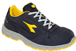
col.60055 dark navy