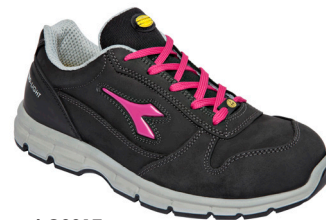
col.C2017 black/fucsia red sizes 35/42

Calzatura di sicurezza bassa S3 in Nubuck Pull Up idrorepellente. Puntale in acciaio 200J. Calzata 10. K SOLE, fodera in Air Mesh, plantare estraibile traspirante con carboni attivi. ESD.