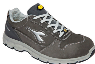
col.75068 castle rock