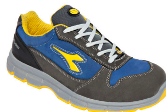
col.C4906 castle rock/insignia blue