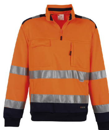
Arancione Fluor/Blu Navy