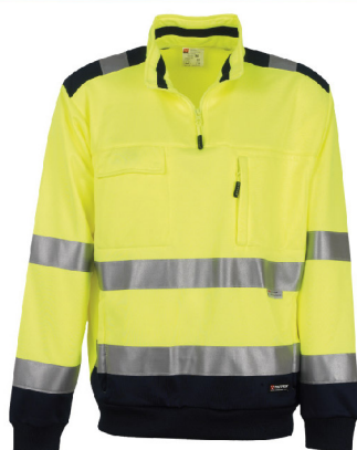
Giallo Fluor/Blu Navy