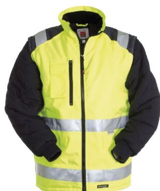
Giallo Fluo/Blu Navy