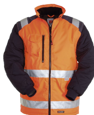
Arancione Fluo/Blu Navy