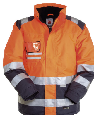
Arancione Fluo/Blu Navy