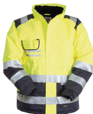
Giallo Fluo/Blu Navy