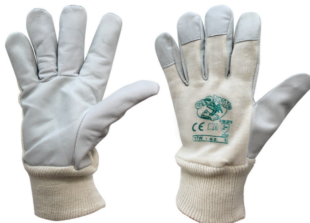
Bianco / White