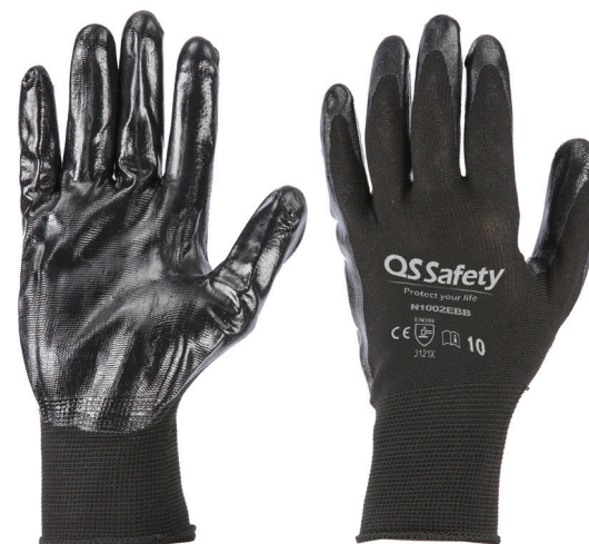
Nero / Black