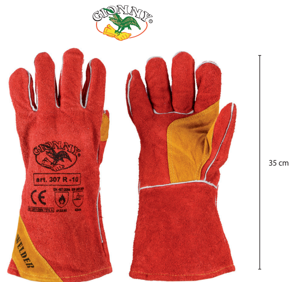
Rosso / Red