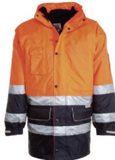
Arancione Fluor/Blu Navy