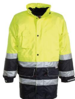
Giallo Fluor/Blu Navy